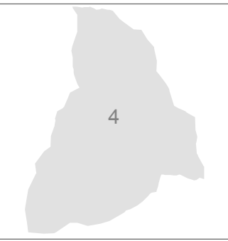
STREMBO II scala 1:200.000